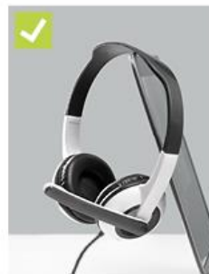
Microphones – dos and don'ts